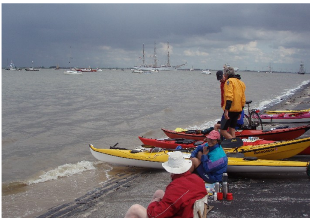
strekdam naar de haven van Delfzijl

De auto's kunnen in de nabijheid geparkeerd worden, maar als het hek naar het gemaal Spijksterpompen dicht is, moeten de boten een stukje gedragen worden tot over de dijk. Als het hek open is, kunnen de auto's tot op de dijk rijden. De tocht naar Borkum wordt er 8 km langer van dan bij vertrek vanaf de Eemshaven.