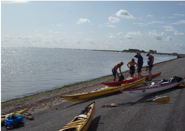
de dijk bij Spijksterpompen (Vierhuizen)

alternatieven een strandje iets meer naar het westen waar de dijk naar het zuiden afbuigt (alleen met hoog water), de hoek van dezelfde dijk als deze weer naar het westen afbuigt (1 km lopen over verharding onder aan de dijk om dat punt te bereiken) en Vierhuizen (zie hieronder).