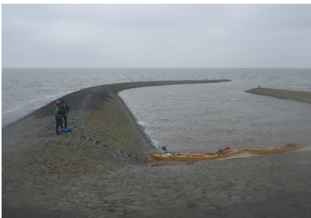
het “haventje” van Roptazijl

Harlingen: De grootste haven van het Wad met veel scheepvaartverkeer, mede omdat het Van Harinxmakanaal daar uitkomt. Kano's kunnen het beste aan het uiteinde van de zuidelijke arm van de haven te water gaan. Daar kun je ook je auto in de buurt laten staan. Een alternatief is op een plek met lage oevers in de grachten van Harlingen in te stappen. Nadeel is dan dat je geschut moet worden voor je de buitenhaven in kunt varen. Niet alle sluizen in de stad worden bediend.