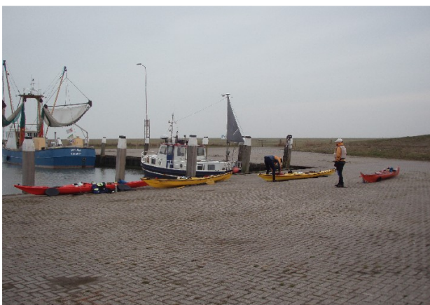
haven van Noordpolderzijl

Noordpolderzijl: Bij laagwater is de haven zelfs voor kano's onbereikbaar en kun je alleen via een van de ijzeren trapjes tegen de kade in en uit het water. Het slik is te zacht om door heen te kunnen lopen. De slagboom is meestal dicht en alleen met een pasje te openen. Door de week is de slagboom zonder pasje te openen als het tenminste niet te druk is. Wanneer er dan een auto voor de slagboom gaat staan, gaat de slagboom zonder pasje omhoog. Voor het openen van de slagboom voor de haven van Noordpolderzijl bellen met: de heer Schoonveld, tel 06-20615951 Waterschap Noorderzijlvest. Wanneer je 's morgens vroeg door de slagboom wilt, bel dan de avond te voren dan zet hij het systeem 's avonds al op "open". Bovenstaande regeling is afgesproken met de heer Schoonveld op 23