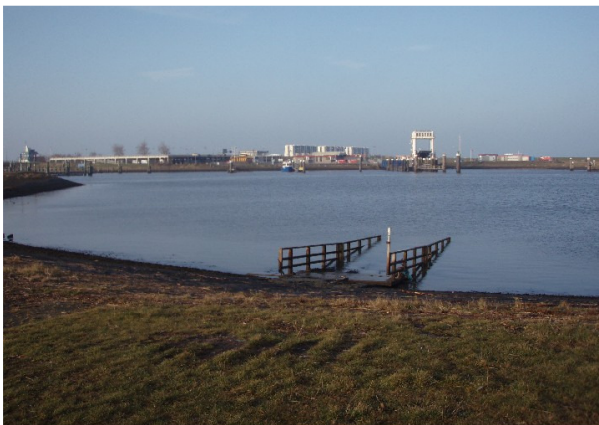
piereind tegenover de veerhaven Lauwersoog

Lauwersoog: Dit is een veel gekozen vertrekpunt voor kanotochten. Er zijn verschillende vertrekmogelijkheden. Bij laag water kun je het beste vertrekken vanaf een steiger in de vissershaven, ondanks de hoge in/uitstap. Tot ca 2 uur voor en na laagwater kun je terecht op de botenhelling tegenover de veerboten aan de kop van de pier, bij het strandje in de hoek van de pier tegenover het restaurant Piereneind en bij het strandje ten oosten van de vissershaven. Bij laagwater kan ook op de kop van de pier uit/ingestapt worden, als je tussen de los liggende stenen, bezet met scherpe Japanse oesters door weet te laveren.