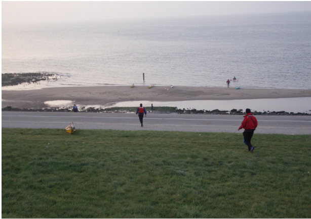
strandje bij Huisduinen

Alle mij bekende vertrekpunten vanaf de vaste wal worden één voor één behandeld van west naar oost, waarbij belangrijke punten als toegankelijkheid, parkeermogelijkheden, bereikbaarheid bij laagwater, e.d. de revue passeren.