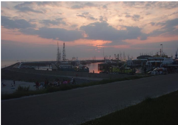
zuidoostelijke arm van de haven van Harlingen

Den Helder: Marinehaven bij de officiersmess, melden bij Traffic Centre Den Helder (tel.0223-542300, marifoonkanaal 62). Paspoort mee. Het schijnt dat je je een maand van tevoren moet aanmelden met opgave van de namen van de deelnemers. Dat maakt in de praktijk de haven praktisch onbruikbaar voor kanoërs.