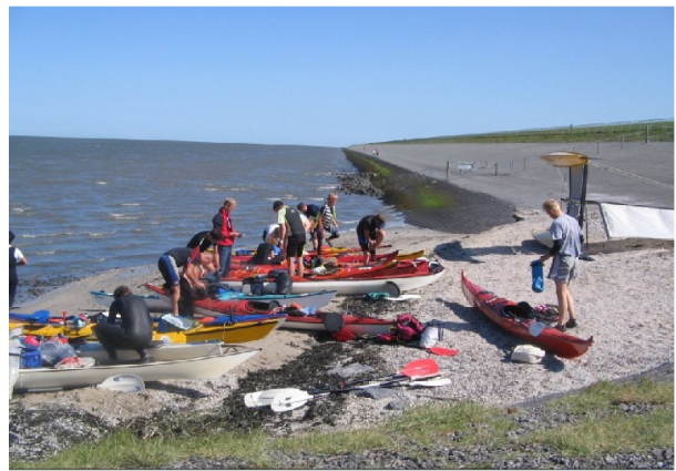
strandje ten oosten van de vissershaven Lauwersoog