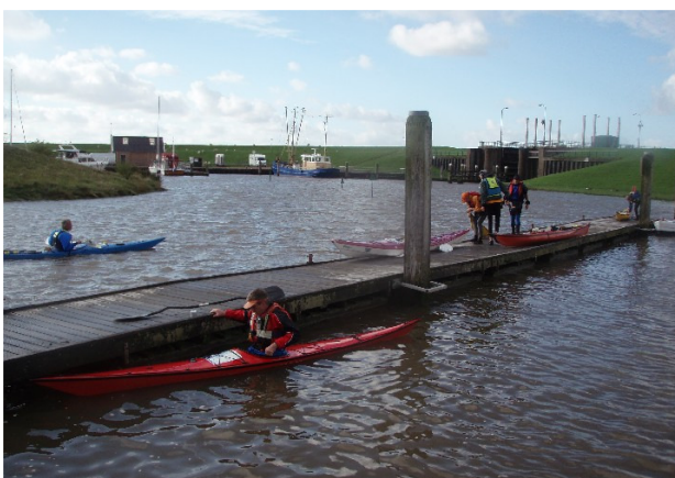
drijvende steigers in de haven van Termunterzijl

Delfzijl: Het strand bij Delfzijl is bij laagwater ongeschikt als vertrek/ aankomstpunt vanwege het droogvallend slik voor het strand. Wel is het mogelijk te vertrekken of aan te landen bij de strandjes aan de strekdam langs het zeehavenkanaal naar de haven van Delfzijl.